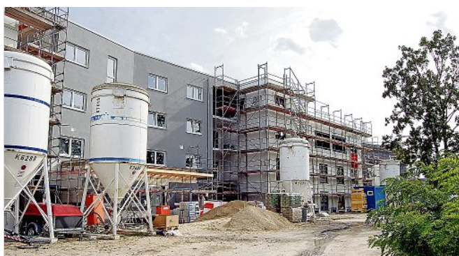
Im Spätsommer 2022 war Start für die Bauarbeiten am Großobjekt „Gepflegt wohnen“. Inzwischen steht der Rohbau.