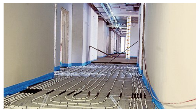
Wie heute üblich wird das Gebäude mit einer Fußbodenheizung ausgestattet. Hier zu sehen sind die Heizrohre.