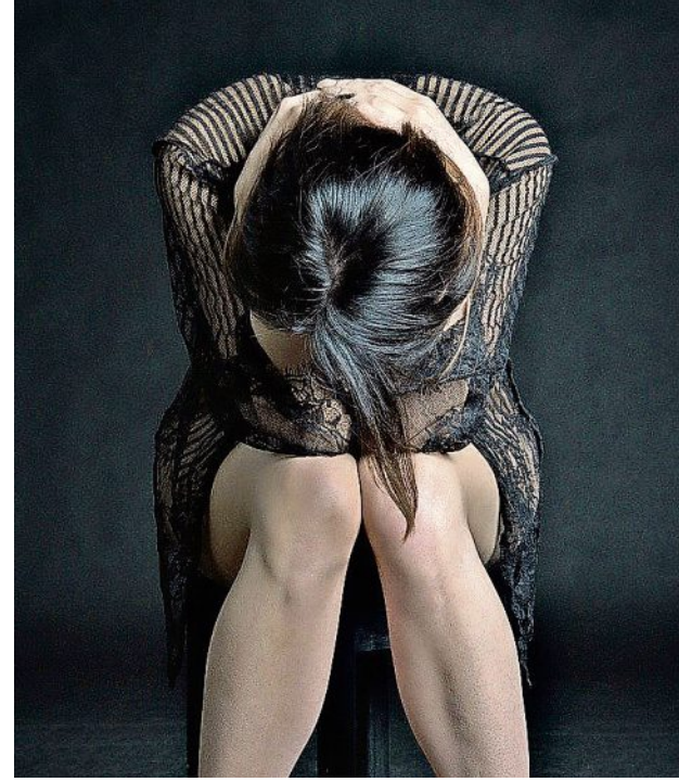
Depression ist längst eine Volkskrankheit der modernen Industriegesellschaft. Und auch für Angehörige nicht ungefährlich.

Neben- und Wechselwirkungen mit anderen Medikamenten kommen. Deshalb darf man diese Mittel nur unter strenger ärztlicher Kontrolle anwenden. Allerdings hat die Entwicklung von Psycho-