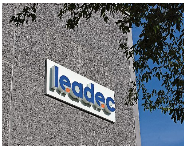
Nach der Integration von AVI in die Leadec-Gruppe wurde nun auch am Firmensitz im WK I „umgeflaggt“.