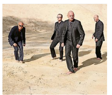
am Samstag, 7.10., um 20 Uhr im Bürgerzentrum Hoyerswerda, Tickets ab 18,70 Euro

In den 80er-Jahren gründeten ein paar Jungs aus dem Cottbuser Stadtteil Sandow eine Band, der sie genau diesen Namen gaben. In der DDR wurden sie bekannt. Zum 35. Geburtstag 2017 produzierten sie ein Konzeptalbum mit dem Titel „Entfernte Welten“, das viel Beachtung fand. Jetzt spielen die vier von Sandow im Hoyerswerdaer Bürgerzentrum.