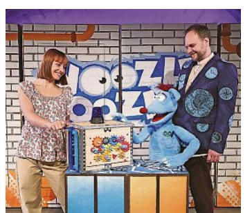
am Freitag, 6.10., um 16 Uhr in der Lausitzhalle Hoyerswerda, Tickets ab 22,60 Euro

Das Theater Lichtermeer gastiert mit seinem Kindermusical „Wozzle Gozzle“ in der Lausitzhalle. Der Kinder-TV-Held nimmt uns mit auf eine Reise durch die Zeit – eine aufregende Mischung aus Schauspiel, Tanz und Musik, bei der es natürlich viel zu erleben, zu lernen und zu lachen gibt – samt einer ganzen Menge toller Songs.