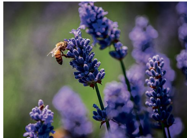
Eine Überdosis Lavendel kann zum Beispiel zu Kopfschmerzen führen, warnen Mediziner.