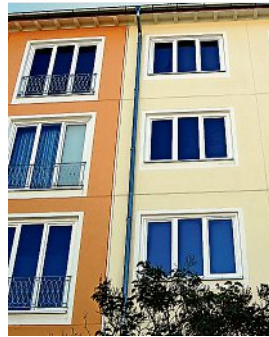
Die meisten der je 48 Wohnungen in den beiden Häusern (hier die Petersstraße 1-7) sind leergezogen.