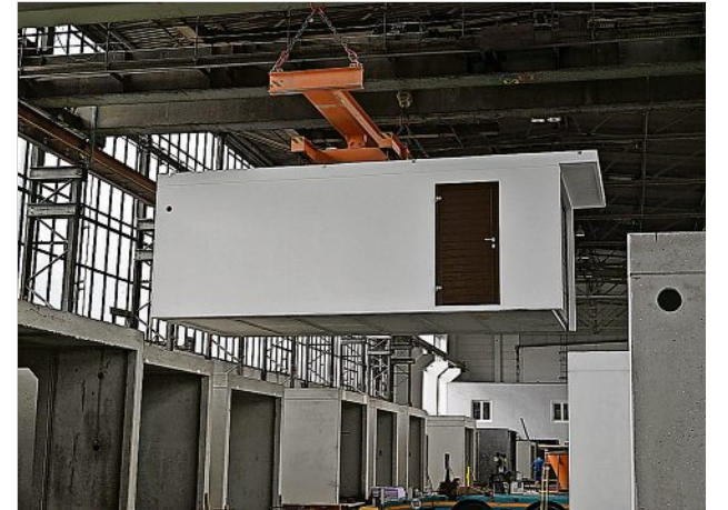
Eine fix und fertig ausgestattete Garage wird für den Transport per Tieflader verladen.

Ähnlich wie bei einer Autobestellung kann man aus bestimmten Vorgaben wählen: Einzel- oder Doppelgarage, Reihen- oder Großraummodell. Ganz individuell wird es bei der Anordnung von Fenstern und Türen sowie bei der Elektrik. Im Betrieb auf dem ehemaligen Betonwerks-Gelände, der zur in der Schweiz beheimateten Broder AG gehört, arbeiten 25 Beschäftigte. (red)