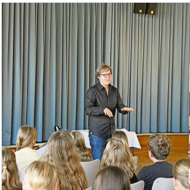
Ein bekannter Vertreter der klassischen Musik als Lehrer – das gibt es nicht alle Tage.

In die Hoyerswerdaer Schule kam Weltstar Vogler nun im Zusammenhang mit dem Programm „KMO meets school“ des Kammermusikfestes Oberlausitz. Dessen Veranstalter ermöglichen zudem 20 Lessing-Schülern im Anschluss an den Besuch einer Ausflugsreise zu einem Vogler-Konzert in Bärnsdorf. (red)