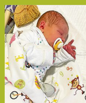
Leon ist das 400. Baby des Jahres