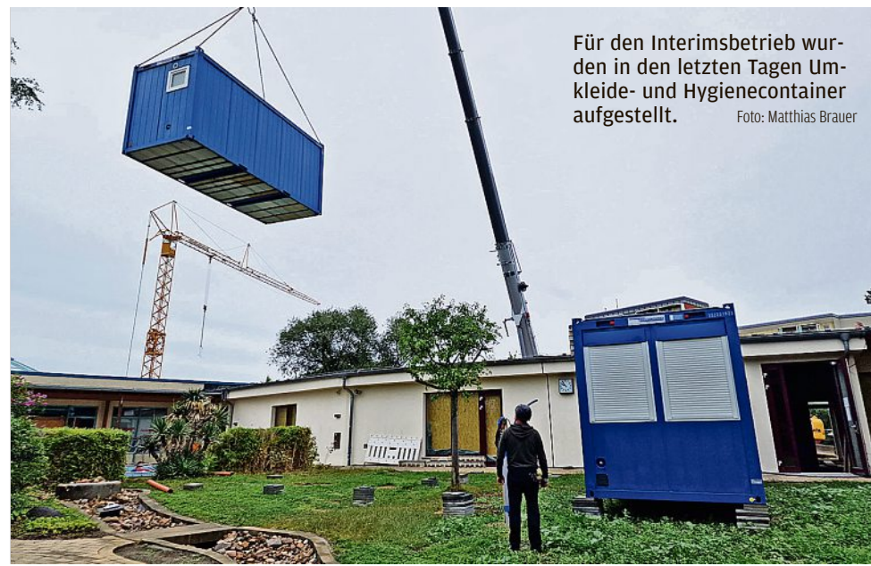
Für den Interimsbetrieb wurden in den letzten Tagen Umkleide- und Hygienecontainer aufgestellt.