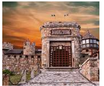
Peter Pan aufgeführt von den Landesbühnen Sachsen am 21.9. um 16 Uhr vor der Jakubzburg in Mortka, Eintritt 26 Euro

Eines Tages steht er plötzlich in Wendys Zimmer: Peter Pan. Dieser Junge, der nie erwachsen werden möchte, seine kleine streitbare Fee und Wendy machen sich auf nach Nimmerland. Ein Land, in dem es allerlei fantastische Wesen, furchterregend-komische Piraten, die „verlorenen Kinder“ und vor allem viele Abenteuer gibt!