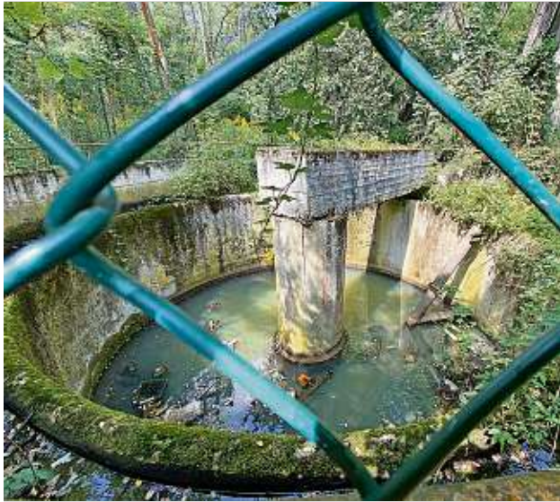
Wer sich einige Meter durch dichtes Gestrüpp gekämpft hat, der bekommt am Ortsrand von Laubusch diese Überreste einer Kläranlage zu Gesicht.

Altanlagen, die einst zur Bri-kettfabrik gehörten, im Rahmen seiner Sanierungspflicht zu beseitigen. Zeitlich ließe sich aber noch nichts Genaues sagen. Laut den der Stadt vorliegenden Erkenntnissen hat die Projektplanung für den Abriss gerade erst begonnen. Lehmann findet aber, es sei erfreulich, dass sich überhaupt etwas tut. (red)