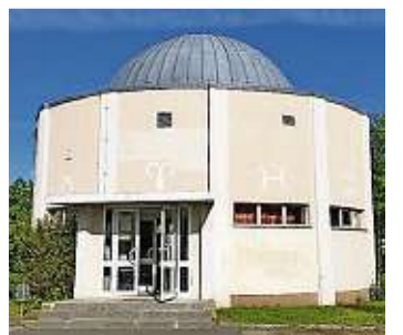
Der Meteoritenfall von Ribbeck - Beobachtung & Meteoritensuche am 27.9. um 19 Uhr im Planetarium Hoyerswerda.

Anfang des Jahres ging ein Meteorit bei Ribbeck westlich von Berlin nieder. Ein „Suchtrupp“ machte sich auf den Weg. Der Vortrag beschreibt alle Details zum Meteoritenfall und zur Suche, verständlich und übersichtlich. Als Höhepunkt wird es nach dem Vortrag echte Meteoriten zu sehen geben, natürlich auch Meteoriten von Ribbeck.