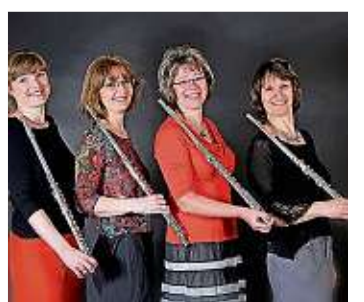
Quartetto giocondo am 29. September um 16 Uhr im Schloss Hoyerswerda, Eintritt 14 Euro

Das Quartetto giocondo wurde 2010 gegründet. Die vier Flötistinnen spielen viele Stilrichtungen von Barock bis zum Jazz. Im Konzert „Eine musikalische Reise durch die Welt“ erklingt unter anderem Musik aus Frankreich, Spanien und England. Aber auch Deutschland mit Musik vom König und Flötisten Friedrich der Große darf nicht fehlen.