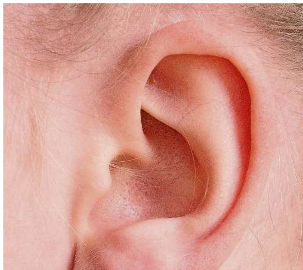
Das Ohr ist die unfassbar wichtige Verbindung zur Welt um uns herum, und das ist wichtig auch fürs Gehirn!

bei einem Hals-Nasen-Ohren-Arzt. Mit fatalen Folgen. Denn schon eine leichte Einschränkung des Hörvermögens – zeigen Studien – können beispielsweise das Auftreten oder Fortschreiten von Demenz befördern. Beginnend bei einer Hörminderung von gut 25 Dezibel, was beispielsweise dem Ticken einer Uhr entspricht. Die Erklärung könnte bei einem Verbleiben mit Muskeln liegen: Werden bestimmte Muskeln nicht mehr trainiert, bilden sie sich zurück. So ist das auch mit Fähigkeiten oder Leistungen des Gehirns; und Hören findet bekanntlich nicht zuletzt im Gehirn statt. Dort werden die als Schwingungen über die Nervenbahnen ankommenden Geräusche umgewandelt und so-