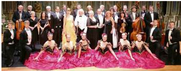
Mitglieder vom NATIONALTHEATER BRÜNN entzündeten ein musikalisches Feuerwerk mit den bekanntesten Operetten-Melodien Traum-Melodien der Operette

Zusammen mit bekannten Solisten, dem FERNSEHBALLETT Prag, das Ganze unterhaltsam moderiert, werden die unsterbliche Operette als ein Rausch farbenprächtiger Kostüme, erstklassiger Stimmen und mitreißender Melodien aufgeführt! Zum Repertoire gehören Titel wie „Kaiser Walzer“, „Can Can“, „Brüderlein und Schwesterlein“, „Tritsch - Tratsch Polka“, „An der schönen blauen Donau“, „Radetzky-Marsch“. Lausitzhalle Hoyerswerda am, 19.10.24 / 15.30 Uhr Karten: zu 24 €, 33 €, 39 €, 45 €; in der Lausitzhalle - T:03571/904105 Touristinfo Lausitzer Seenland, im SZ-Treffpunkt im Lausitzcenter, und in den www.Eventim.de Vorverkaufsstellen - auch online möglich