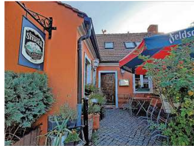
Erst am Abend erwacht das Anno 1900 in der Hoyerswerdaer Altstadt zum Leben. Findet sich ein Gastronom, der das Haus und die Einrichtung übernimmt?

In der Altstadt wird nach einer Lösung für eine Gaststätte gesucht. Das Anno 1900 (vormals Gildenstube, vormals Hackerstübl) in der Langen Straße schließt in einem Monat. Die Betreiberin findet kein Personal. Der Eigentümer würde sowohl neu vermieten wie auch verkaufen. Die beiden Beteiligten sagen, es habe zuletzt zwar zwei oder drei Interessierte gegeben. Es sei jeweils aber nichts daraus geworden. Die Gaststätte besteht an Ort und Stelle seit 30 Jahren. (red)