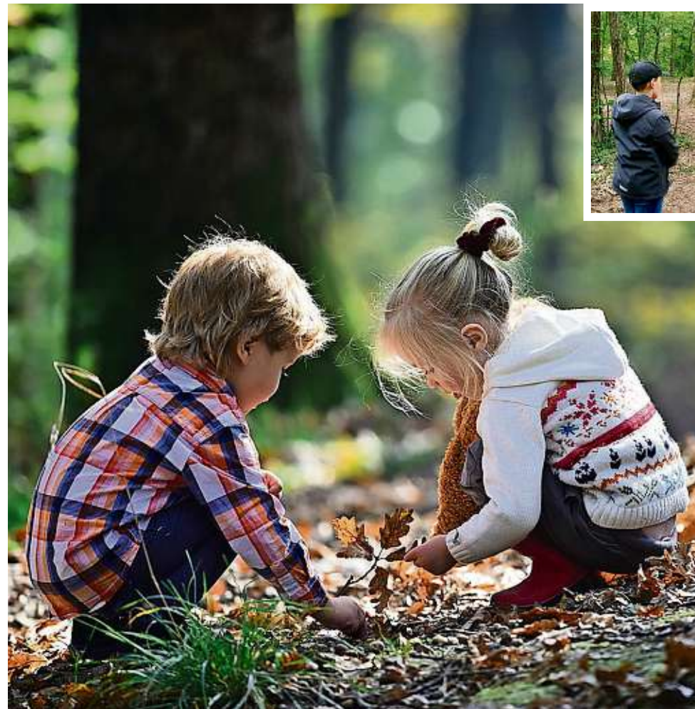
Mit einfachen Mitteln lassen sich vielfältige Spiele in den Waldspaziergang einbauen.

Wie beim Baumspiel bilden sich Zweiertteams: Diesmal ist ein Teilnehmer die Kamera, der andere der Fotograf. Die Kamera schließt die Augen und lässt sich vom Fotografen vorsichtig an den Schultern durch den Wald oder über die Lichtung schieben. An der Stelle, an der ein Foto entstehen soll, halten beide an – und der Fotograf bringt die Kamera in Position. Auf ein verabredetes Signal hin, das den Auslöser symbolisiert, öffnet die Kamera kurz die Augen und schließt sie gleich wieder. Das Bild, das sie in diesem Moment gesehen hat, versucht sie später so gut wie möglich zu beschreiben oder zu skiz-