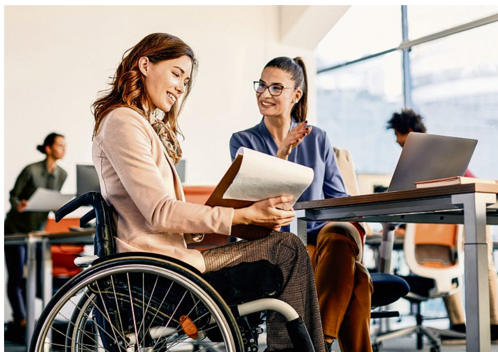
Inklusion in der Arbeitswelt ist bei Behinderungen Thema, aber auch, wenn Menschen nach einer Erkrankung nicht mehr ganz gesund werden.

Auch der Gesetzgeber habe etwa mit dem „Gesetz zur Förderung eines inklusiven Arbeitsmarkts“ Voraussetzungen geschaffen, um die berufliche Teilhabe zu verbessern und zu fördern. Fakt ist, dass Unternehmen immer stärker mit