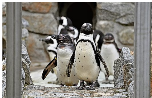
Die Brillenpinguine im Zoo Hoyerswerda kommen mit den derzeitigen Temperaturen klar, echte Kältefans sind sie aber nicht. Wer lange genug vor der Anlage ausharrt, kann sie sogar beim Schwimmen beobachten.

Mit ein bisschen Bangen blickt man ja auf die Pinguinanlage im Zoo, wo nach 24-jähriger Haltung von Humboldt-Pinguinen 2021 plötzlich das große Sterben einsetzte. Aber nach nun mehrfachen baulichen Anpassungen scheinen die neuen Brillen-Pinguine zumindest dem Augenschein nach wohl auf. 18 Tiere waren im Herbst angeschafft worden, die ersten hundert Tage mit der im Süden Afrikas beheimateten Art sind jetzt vergangen. Im Prinzip können die Pinguine zwischen Stall und Außenanlage wechseln, wie sie wollen. Eine Ausnahme ist der Silvestertag.