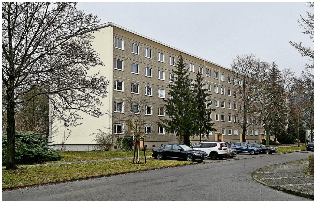
Der Fünfgeschossiger Gneisenaustraße 57-63 im Hoyerswerdaer WK IX wird in einem halben Jahr zur Großbaustelle. Er soll zum Betreuten Wohnen umfunktioniert werden. Die Betreuung erfolgt nicht über die LebensRäume-Genossenschaft, sondern über einen privaten Partner, der bislang nicht konkret benannt wird.