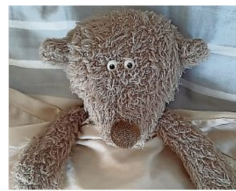
Das Traummonster! am Sonntag, 14.1.24, um 15.30 Uhr, Kulturfabrik Hoyerswerda, für Kinder ab 4 Jahren

Der kleine Hänsel träumt jede Nacht von bösen Monstern und gefährlichen Räufern. Er fürchtet sich einzuschlafen. Wer kann helfen? Dr. Schlafgut zeigt ihm, wie er gemeinsam mit seinem Kuscheltier im dunklen Wald Albträume besiegt. Dort trifft er bekannte Märchenfiguren wie Gretel, eine Hexe und Räuber.