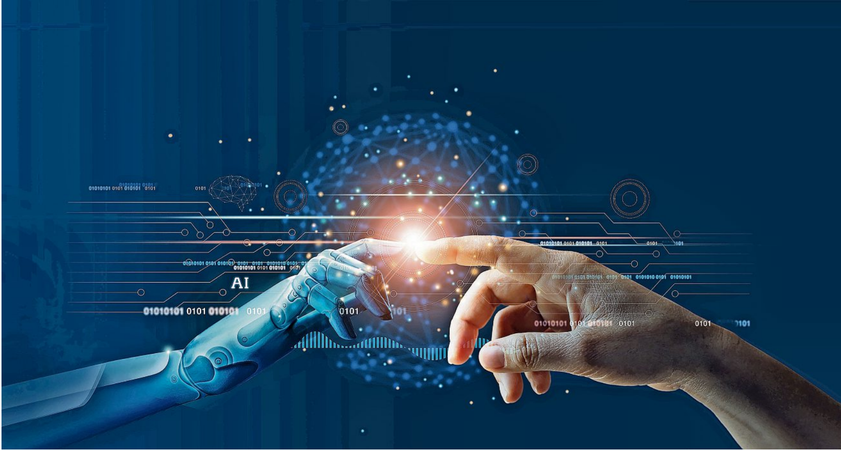
Mensch oder Maschine? Das ist hier tatsächlich nicht die Frage. Die KI wird die Arbeitswelt zunehmend stärker beeinflussen. Das wirft Fragen auf, bringt aber auch neue Chancen.

Ohne die Künstliche Intelligenz geht kaum noch etwas. Das verändert die Arbeit auch in Sachsen, bringt aber genauso neue Perspektiven.