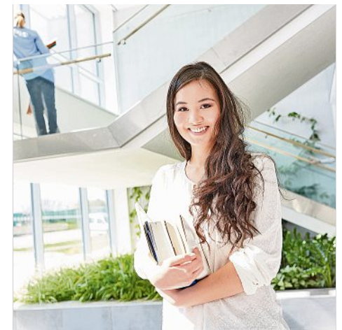
Bereit zum Studium? Orientierung zu den Möglichkeiten in der Lausitz und Sachsen gibt der Hochschulinfotag.

web www.pack-dein-studium.de/Termine.html