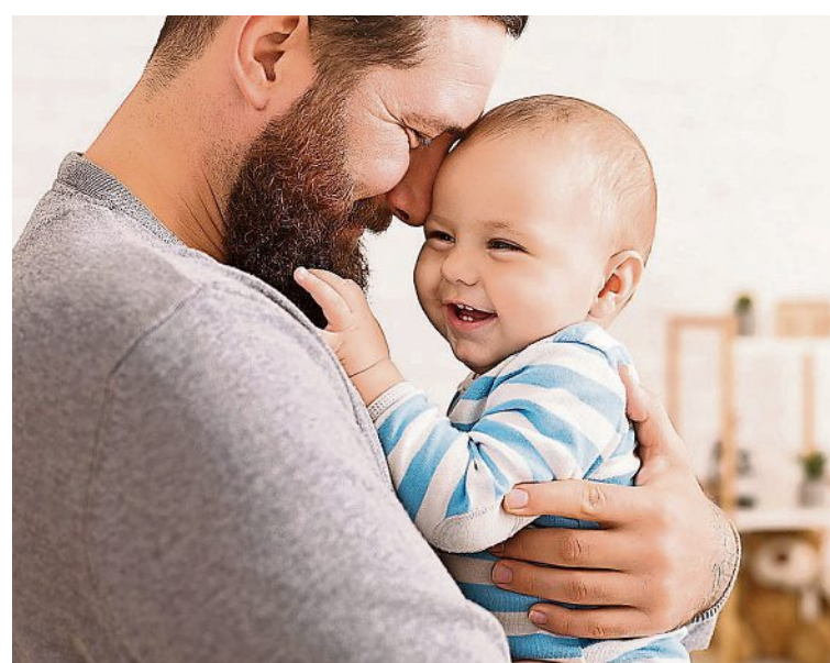
Kuscheln ist ein Grundbedürfnis der Menschen.

tin Grunwald. Er ist Haptik-Forscher an der Medizinischen Fakultät der Universität Leipzig. Die positive Wirkung von wohlmeinenden Berührungen ist sogar messbar. Wenn wir Umarmungen und Streicheleinheiten bekommen, werden Oxytocin und Serotonin ausgeschüttet, die sogenannten Kuschel- und Glückshormone. Oxytocin