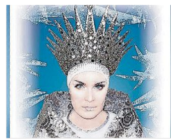
Die Schneekönigin am Samstag, 6.1.24 um 15 Uhr, Lausitzhalle Hoyerswerda, Eintritt ab 19,60 Euro

Die faszinierende Geschichte der Schneekönigin wird präsentiert von einem achtköpfigen Ensemble. Das ist seit 2012 erfolgreich auf Tournee und bezaubert Kinder, Kind gebliebene und Märchenfreunde mit eingängigen Songs, witzigen Dialogen, berührenden Szenen und Choreografien zum Nachmachen.