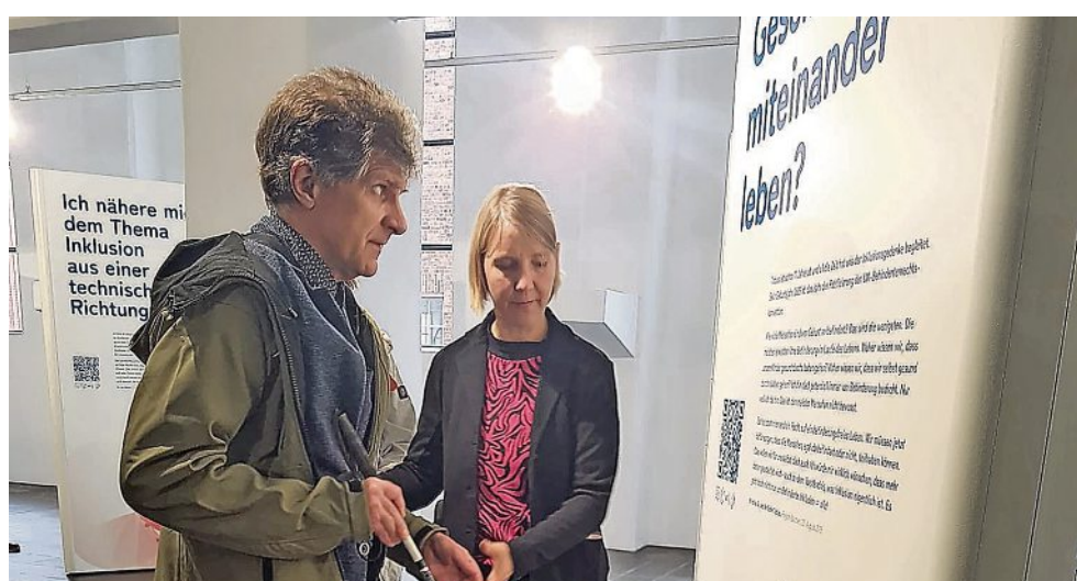
In der Ausstellung „Weil Vielfalt fetzt“ geht es um Inklusion im Alltag.

Zu entdecken gibt es seitdem die Porträts von Menschen, „die durch inklusive Angebote neue Chancen und Möglichkeiten erfahren oder aufgrund fehlender Inklusion auf Hindernisse und Probleme sto-