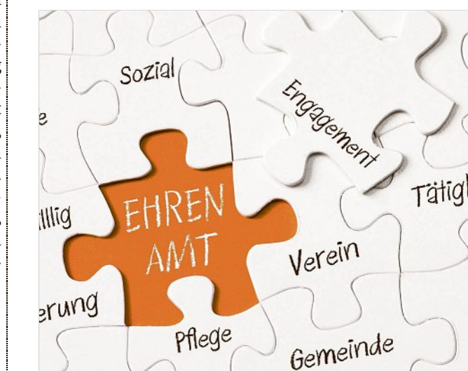
Frauen, die sich ehrenamtlich besonders engagieren, haben eine Chance auf die „Martha“-Auszeichnung.

Vorschlagsberechtigt sind alle Hoyerswerdaer Bürgerinnen und Bürger sowie Vereine und Verbände. Bedingung für die Auszeichnung: Sie muss Hoyerswerdaerin sein. Vorschläge können bis zum 26. Januar 2024 bei der Stadt Hoyerswerda, Büro des Oberbürgermeisters, Markt 1, in Verbänden oder einfach in der Allgemeinheit durch besonderes „Tätigsein“ herausragenden weiblichen Persönlichkeit gelten. Mit dieser Auszeichnung wird eine Möglichkeit geboten, das starke Engagement und die Courage der Frauen hervorzuheben.