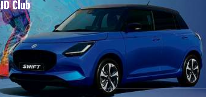
Abbildung zeigt aufpreispflichtige Sonderausstattung.

SUZUKI FAN WOCHE Aktionsangebote bis 30.9.2024