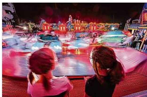
Im vergangenen Jahr drehten sich die Fahrgeschäfte ordentlich. So wird es auch beim diesjährigen Stadtfest in Hoyerswerda sein.

Bis zum Stadtfest sind es nun noch gut eine Woche. Wenige Tage zuvor beginnt der Aufbau. Der folgt den bewährten Regeln, dass die Bühne direkt vor der Lausitzhalle errichtet wird, auf dem Lausitzer Platz sich dann die meisten Versorgungsstände befinden. Auf der Mehrzweckfläche zwischen Lausitz-Center und Zentralpark sowie am Lausitztower werden sich die Fahrgeschäfte des Lausitzer Schaustellerverbandes präsentieren. In diesem Jahr bieten sich dafür neue Möglichkeiten, da die bisherigen Pflanzinseln in der Pflasterfläche beseitigt wurden. Kürzlich wurde auch die benötigten Stromanschlüsse erneuert, um die Anzahl der Kabelstränge auf dem Festgelände zu verringern.