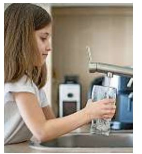
Ausreichend zu trinken, ist auch für die Augen wichtig!

Wer an trockenen Augen leidet oder von trockener Büro- oder Wohnungsluft umgeben ist, sollte unbedingt viel trinken. Zwei bis drei Liter Wasser oder ungesüßter Tee pro Tag sind die richtige Menge, wissen Augenmediziner. Denn wer reichlich Wasser trinkt, gibt nicht