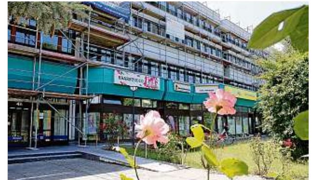
Die Gerüste sind gestellt, die Malerfirma hat mit ihrer Arbeit begonnen. An Hoyerswerdas Einsteinstraße wird die Fassade neu gemalert.

ßend auf der Hofseite wieder schick gemacht. Vonseiten des Immobilieneigentümers, der VAE Verwaltungs GmbH, heißt es, auch der Petrol-Grün gehaltene Fries werde noch folgen. Man sei sich hier aber noch nicht sicher, ob es bei der aktuellen Farbe bleiben soll oder nicht und sei für entsprechende Meinungsäußerungen aus der Bevölkerung dazu dankbar. (red) Kontakt: Telefon 03571 - 91 19 28 oder mail an: info@vae-verwaltung.de