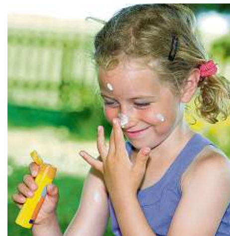
Vor dem Aufenthalt in der Sonne gut eincremen!

Sandkuchen backen, mit Wasser „matschen“, Ball spielen oder die Natur erkunden: Für Kinder ist der Sommer eine herrliche Jahreszeit. Meist halten sie sich viel länger im Freien auf als Erwachsene und sind so der Sonne stärker ausgesetzt – obwohl ihre Haut deutlich empfindlicher ist. „Sie muss deshalb konsequent vor UV-Strahlung geschützt werden“, heißt es bei der Bundeszentrale für gesundheitliche Aufklärung (BZgA). „Wer von Kindesbeinen an zu viel davon abbekommt, hat im späteren Leben ein erhöhtes Risiko, an Hautkrebs zu erkranken.“ Zudem altere die Haut vorzeitig. Daher sei es wichtig, Sonnenbrände so gut wie möglich zu vermeiden. Babys sollten gar keiner direkten Sonne ausgesetzt werden, größere Kinder zumindest nicht in der Mittagszeit. Ansonsten schützen leichte Kleidung, die viel von der Haut bedeckt, ein Sonnenhut und auf