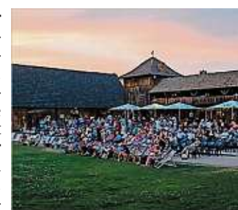
Filmnächte an der Krabat-Mühle vom 11. Juli bis 11. August in Schwarzkollm, www.schwarzkollm.filmnaechte.de

Die kleine Schwester der Filmnächte am Elbufer startet am Donnerstag in Schwarzkollm. Wieder bildet die Krabatmühle das passende Ambiente. Zum Auftakt läuft ab 21.30 Uhr „Poor Things“, am Freitag zu gleicher Zeit „Furiosa“. Gleich drei Streifen laufen dann Samstag und Sonntag. Filmstart ist jeweils 10.30 Uhr, 16 Uhr und 21.30 Uhr.