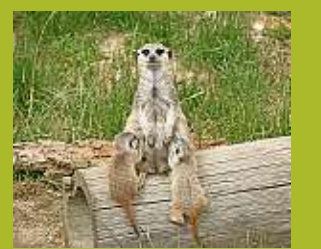
Erdmännchen-Nachwuchs im Hoyerswerdaer Zoo.

Jetzt sind es 13! Und das ist für den Zoo Hoyerswerda eine echte Glückszahl; denn es geht um die Erdmännchen-Familie im Zoo. Die ist auf besagte 13 Familienmitglieder angewachsen. Gleich zwei Jungtiere erkunden ihre Anlage – noch ein bisschen tapsig, aber natürlich sind sie schon jetzt echte Publikumsliebhaber. Lieblingsbeschäftigungen, heißt es aus dem Zoo, sind neben schlafen und fressen vor allem, die Großen zu imitieren und nach Insekten zu graben. Noch ist übrigens nicht klar, welches Geschlecht die Kleinen haben. Das wird aber bei der nächsten routinemäßigen Tierarztkontrolle festgestellt, verrät Zoonsprecherin Stefanie Jürß. In jedem Fall ist die Erdmännchen-Familie sicher einer von vielen spannenden Gründen, dem Zoo jetzt in den Sommerferien einen Besuch abzustatten.