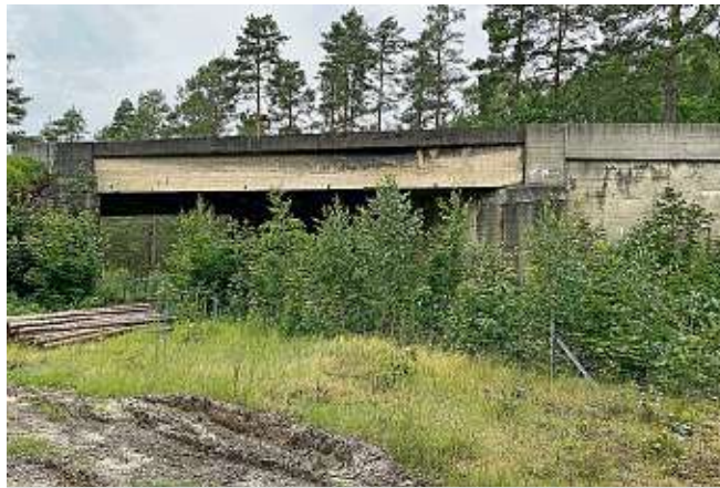
Über diese Brücke rollt der Verkehr auf der B 97 zwischen Großgrabe und Schwepnitz. Früher verliefen hier die Bahngleise der Zugverbindung zwischen den Bahnhöfen Straßgräbchen-Bernsdorf und Königsbrück. Die Schienen sind längst verschrottet, die einstige Trasse zugewachsen. Anstelle der Brücke soll ein Wilddurchlass gebaut werden.

schen Landesamtes für Straßenbau über den Stand der Dinge informiert. Demnach soll zunächst - ins Auge gefasst ist das nächste Jahr - die zwischen Großgrabe und Schwepnitz. Im Bernsdorfer Stadtrat hat jetzt ein Vertreter des sächsi-