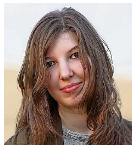
Augen können nicht nur sehen, sondern auch „sprechen“ ...

Sagt ein Blick manchmal wirklich mehr als tausend Worte, wie es der Volksmund meint? Ja, denn unsere Augen verraten durchaus, was wir fühlen, denken und uns manchmal nicht zu sagen trauen. Wenn wir erschrecken oder Angst haben, reißen wir oft die Augen weit auf. Sind wir glücklich, können unsere Augen regelrecht strahlen. Und wir können das alles nicht wirklich steuern, denn unsere Augen reagieren quasi von selbst, ganz unbewusst.