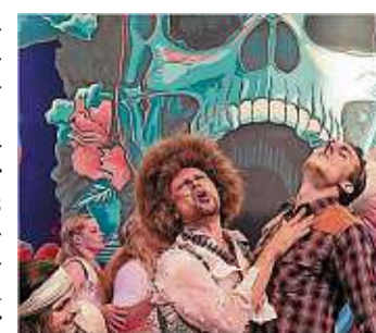
OpenAir-Theater noch bis 8. September auf der Freilichtbühne am Senftenberger See; www.theater-senftenberg.de

Auf der Bühne des Amphitheaters am Senftenberger See läuft die Saison auf vollen Touren. Die Neue Bühne Senftenberg zeigt in dieser Woche zweimal das Märchen vom gestiefelten Kater – am Mittwoch um 10 Uhr und am Sonntag um 15 Uhr – und das Musical „Hair“ am Donnerstag, Freitag und Samstag jeweils um 19.30 Uhr.