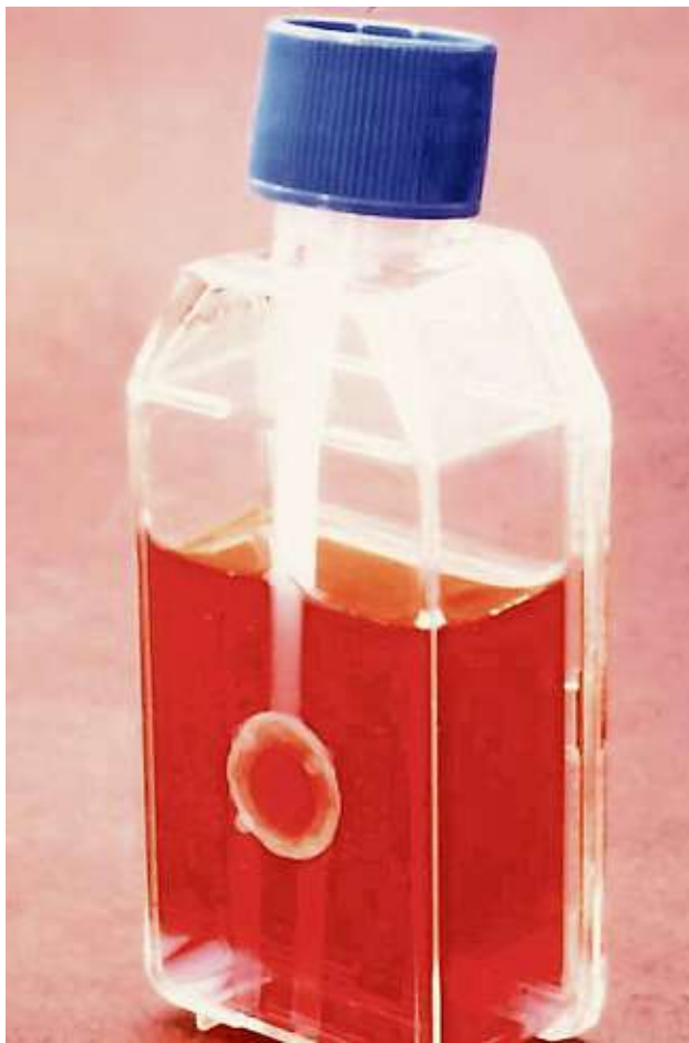
Am Uniklinikum Dresden gibt es eine Hornhautbank für gespendete Augenhornhaut. Die wird dabei zunächst in einer Nährlösung aufbewahrt.

An der Dresdner Uniklinik zum Beispiel gibt es eine sogenannte Hornhautbank. Hier liegen Implantate, die Betroffenen helfen können. In Deutschland gibt es aktuell mehrere tausend Menschen, die auf eine Hornhauttransplantation warten, heißt es aus der Uniklinik. Allein in Dresden sind es über 100 Patienten. Und die brauchen Geduld, mitunter kann bis zu zwei Jahren dauern, dass sich eine ge-