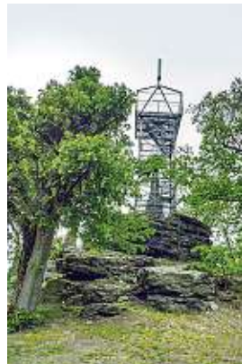
Aussichtsturm auf dem Keulenberg; Fernglas nicht vergessen!

Beliebtester Ausgangspunkt ist die Gemeinde Oberlichtenau, zu deren Territorium der Berggipfel gehört und von wo aus es mehrere Möglichkeiten für den Auf- und Abstieg gibt. Dadurch sind Rundwanderungen möglich, die teilweise auch den reizvollen Oberlichtenauer Liederweg berühren. Weitere mögliche Startorte sind die Stadt Königsbrück, die von Dresden aus mit der Regional-