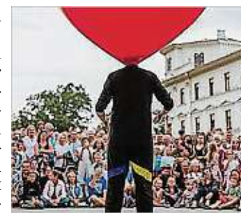
am 7. Juli von 14 bis 19 Uhr in der Hoyerswerdaer Altstadt, Eintritt frei, Sponsoring erwünscht

Bunt, schrill, lustig und vor allem international: Mit Hilfe des ViaThea in Görlitz beleben wieder Clowns, Artisten, Musiker und Straßenkünstler die Altstadt. Neben dem Gelände des Kufasommersgartens, den Plätzen auf dem Markt und an der Johanneskirche wird in diesem Jahr auch wieder hinter der Brücke am Kino die kleine Wiese bespielt.