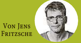
VON JENS FRITZSCHE