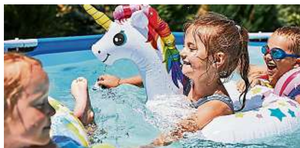
Ein Pool sorgt im Sommer für Spaß und Abkühlung – ein paar Dinge sind dabei zubeachten.

Ansonsten sollte der Standort möglichst sonnig sein, damit sich das Wasser schnell aufheizt. Um eine Verunreinigung zu vermeiden, das Becken ab-