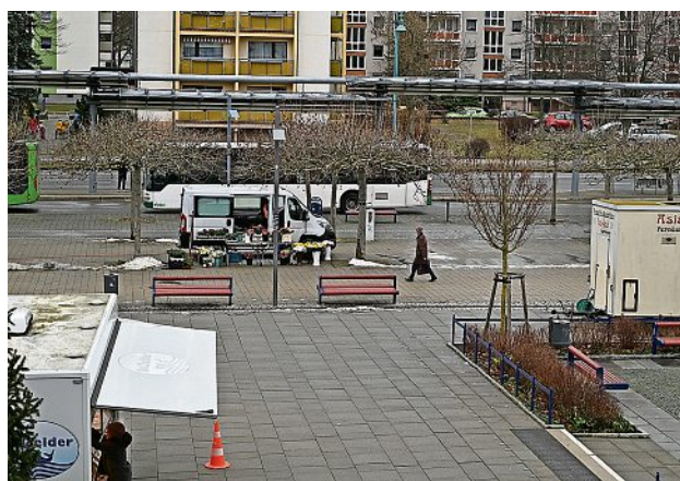
Fast drei Jahrzehnte gedeihen die Platanen schon auf dem Lausitzer Platz. Jetzt soll der Bereich nicht noch weiter verdichtet werden.

nutzt. Grund: Unter den Bäumen hat sich der Boden so stark verdichtet, dass die Wurzeln nach oben drücken statt nach unten zu wachsen. Der Erhalt der Platanen habe aber hohe Priorität. Bisher hätten sieben Händler in diesem Bereich gestanden. Wegen der Neustrukturierung müssen aber auch andere umziehen. (red)