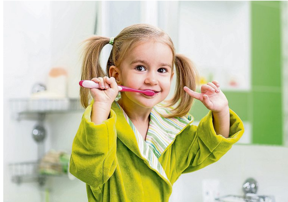
Schon im jungen Jahren ist die Zahnpflege von äußerster Bedeutung und muss täglich mehrmals durchgeführt werden.

Die neuen Empfehlungen sehen die Prophylaxe mit Fluorid bereits ab der Geburt des Kindes vor. Eltern geben ihrem Baby täglich eine Tablette mit Fluorid und Vitamin D. Ab dem ersten Milchzahn sollten Mama und Papa dann die Zähne ihres Babys mit einer altersgerechten Zahnbürste putzen. Zuerst vielleicht nur einmal am Tag, dann aber zunehmend morgens und abends als festes Ritual. „Dabei putzen sie entweder mit einer reiskorngroßen Menge fluoridhaltiger Zahnpasta. Oder sie geben weiterhin täglich eine Tablette mit Fluorid und Vitamin D und putzen