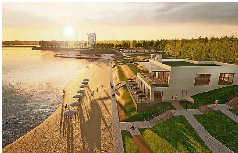
Die beiden in der Visualisierung zu sehenden Gebäude sind für einen zweiten Bauabschnitt geplant, für den anders als beim ersten das Fördergeld noch beantragt werden muss.