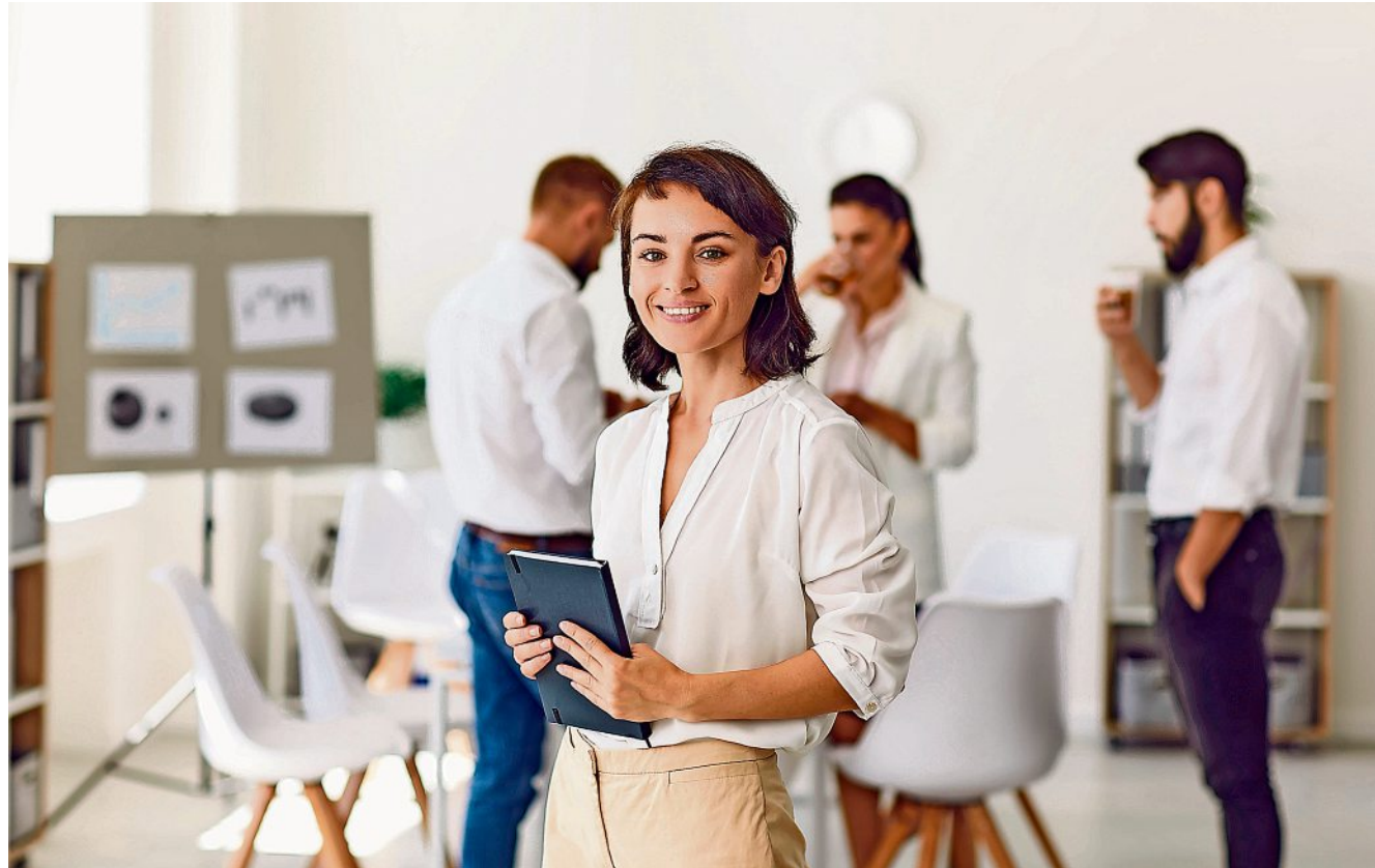
Eine gute Idee und unternehmerischer Mut sind das Wichtigste, ohne starke Partner, Kapital und die Vereinbarkeit von Beruf und Familie wird das Gründen trotzdem zum Hürdenlauf. Sachsen zeichnet erfolgreiche Gründerinnen aus.

In wirtschaftlich schwierigen Zeiten selbst ein Unternehmen zu gründen erfordert Mut. Es braucht außerdem neben einer guten Idee auch Kapital und ein starkes Team. Das alles gilt für Frauen und Männer gleichermaßen. Potenzielle Gründerinnen haben aber auch im Jahr 2024 häufig noch stärker das Problem, Familie und Unternehmen unter einen Hut zu bringen als ihre männlichen Konkurrenten. Bisweilen fehlen ihnen auch tragfähige Netzwerke, in denen Männer Studien zufolge nach wie vor stärker eingebunden sind. Frauen, die sich mit ihrer Idee dennoch durchsetzen, gibt es trotzdem immer mehr. Sachsen würdigt sie mit einer eigenen Auszeichnung. Die nächste Auflage des Sächsischen Gründerinnenpreises ist gerade gestartet. Vergeben wird der Preis vom Sächsischen Staatsministerium der Justiz und für Demokratie, Europa und Gleichstellung. Er soll „das unternehmerische Handeln von Frauen im Freistaat“ würdigen. Gesucht wird in drei Kategorien. Jeweils 5.000 Euro gibt es für eine Gründerin, deren Unternehmen seit weniger als drei Jahren am Markt ist, sowie eine Gründerin, deren Firma länger besteht. Mit der gleichen Summe ist der von der AOK Plus Sachsen/Thüringen gestiftete Nachhaltigkeits-