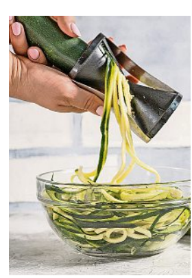
Mit dem Spiralschneider sind gesunde „Nudeln“ schnell gemacht.

Spaghetti, Spirelli, Tortelloni oder Farfalle – Kinder lieben sie alle. Doch in vielen Familien kommen sie abends auf den Tisch, was uns Erwachsenen meist figurtechnisch weniger gut bekommt. Wer auf der Suche nach einer kohlenhydratärmeren Alternative ist, stößt unweigerlich auf Pasta aus Hülsenfrüchten. Die gibt es mittlerweile fast überall fertig zu kaufen. Basis dafür sind beispielsweise rote Linsen oder Kichererbsen. Low carb, dazu noch schnell und einfach selbst gemacht, sind auch Gemüse-Spaghetti.