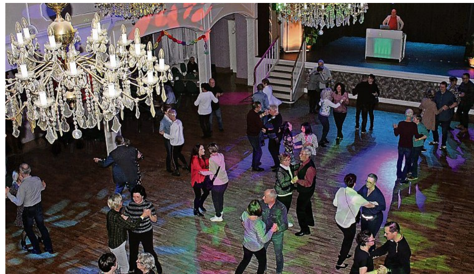
Tanzen ist Lebensfreude pur – das konnten die zahlreichen Gäste der DanceNight live erleben.