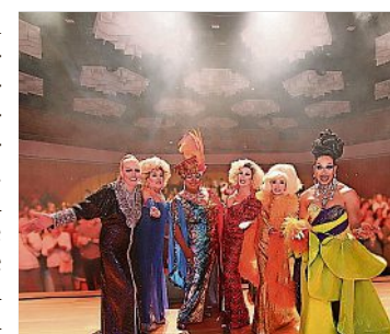
Magie der Travestie am Samstag, 17. Februar 2024, um 20 Uhr in der Lausitzhalle Hoyerswerda

Frech, witzig und doch charmant – extravagante Kostüme und funkelnder Schmuck sorgen für leuchtende Augen und offene Münder. Starimitationen lassen Sie staunen, singen Sie mit zu Evergreens. Die Paradiesvögel in ihren hinreißenden Kleidern werden nichts unversucht lassen, um die Stimmung im Saal zum Brodeln zu bringen.