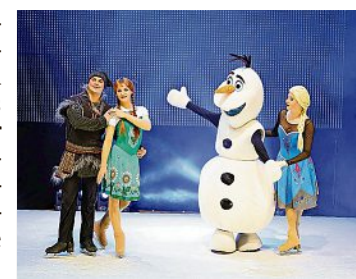
Die Eiskönigin ist zu sehen am Samstag, 10. Februar 2024, um 15 Uhr und 19 Uhr (Zusatzshow aufgrund hoher Nachfrage) in der Lausitzhalle Hoyerswerda

Jetzt kommen die gefeierten Songs der Animationsfilme Frozen 1 und 2 auf die Bühne und dies gleich in spektakulärer Form – auf Eis! Elsa, Anna, Olaf, Sven und Kristoff zeigen ein Eisspektakel für die ganze Familie mit Eistanzern, Akrobaten aus Circo de Cuba sowie innovativer Bühnentechnik und in einem eindrucksvollen LED-Bühnenbild.