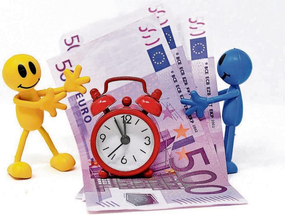
Der Volksmund ist ja bekanntlich der Meinung, dass Zeit Geld ist. Aber gehört beides wirklich so unbedingt zusammen? Oder sorgt diese Kombination nicht einfach für noch mehr Stress?