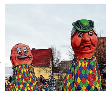
Wittichenauer Rosenmontags-Umzug am 12. Februar ab 13.30 Uhr in der Wittichenauer Innenstadt

Der große Rosenmontags-Umzug ist der Höhepunkt beim Wittichenauer Karneval. Die Wagenbauer und Fußgruppen präsentieren den zahlreichen Menschen am Straßenrand in der Wittichenauer Innenstadt ihre Ideen der Saison. Darüber hinaus laden die vielen Bars zum kleinen Umtrunk und zur Stärkung vor und nach dem Umzug ein.