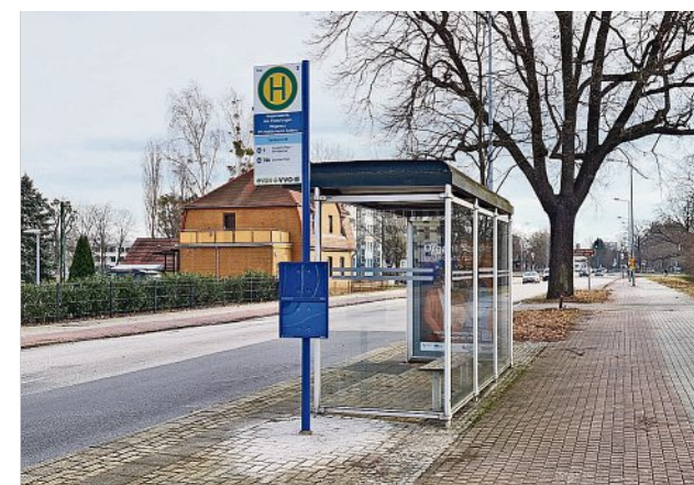
Beispielsweise die Schilder der Haltestellen „Am Elsterbogen“ wurden Anfang der letzten Woche erneuert.

mindest in der Stadt langsam zum Ende. Erneuerungen gab es dieser Tage zum Beispiel am Elsterbogen oder am Zoo. Hier sind aus den grünen Masten blaue geworden und die Beschriftung wurde angepasst. Bis Ende Juni sollen laut VGH in Hoyerswerda auch die letzten 60 Masten erneuert sein. Start war hier im März 2020 am Lausitzbad. Im gesamten Bereich von VVO und ZVON wurden und werden 5.900 Schilder ausgetauscht. Die Reihenfolge richtet sich im Wesentlichen nach Alter und Qualität der vorhandenen Schilder. (red)