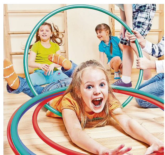
Hoop hoop hurra: Mit Hula-Reifen kann man richtig Spaß haben.

Hula-Hoop-Reifen gehören zu den meist verkauften Sport- und Spielgeräte in den vergangenen Monaten. Kein Wunder, ermöglichen sie doch auf relativ kleinem Raum ein Fitnesstraining, das Groß und Klein Spaß machen kann – wenn man den Dreh erst einmal raus hat. Damit der Reifen ordentlich um Bauch und Hüfte rotiert, positioniert man die Füße hüftbreit oder in leichter Schrittstellung, dann nochmal sichergehen, dass genug Platz ringsum ist und keine Vasen oder technischen Geräte zu Boden und Bruch gehen können. Mit beiden Händen den Reifen auf Taillenhöhe halten und mit Schwung in eine Richtung schubsen. Dann die Hüfte vor und zurückbewegen und den Reifen quasi immer wieder „abschubsen“. Auch wenn der Reifen schnell wieder zur Erde fällt – nicht aufgeben, mit ein bisschen Übung kommt irgendwann der Moment, in dem man merkt, dass es funktio-