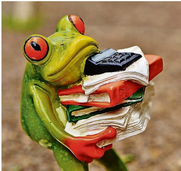
Stress auf Arbeit und im Alltag kann krank machen. Hilfe gibt es – aber dringend von Fachleuten!

Im Internet sind eine Menge Selbsttests zu finden, die eine Gefährdung oder gar schon Erkrankung diagnostizieren helfen sollen. Aber Vorsicht! Hier sollte dringend auf die Seriosität der Quelle geachtet werden – und eines ist ohnehin klar: Ein Gespräch mit einem Hausarzt oder letztlich auch einem Facharzt für Psychiatrie und Psychotherapie