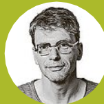
VON JENS FRITZSCHE