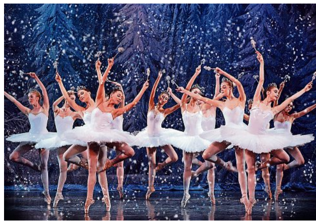
Das Royal Classical Ballett gastiert an diesem Sonntag mit dem „Nussknacker“ in der Lausitzhalle Hoyerswerda.

Ein traumhaftes Winterballett für die ganze Familie steigt Sonntag in der Lausitzhalle.