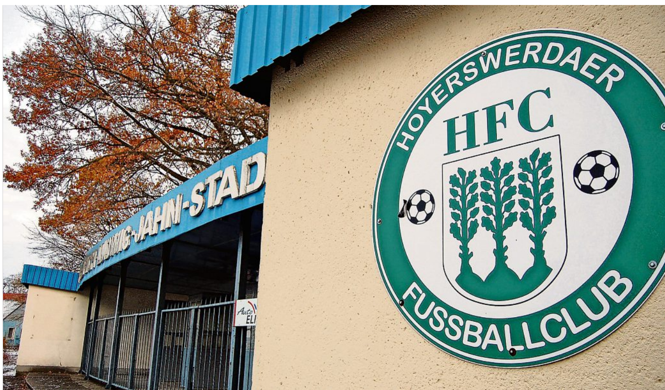
Hier und im Sportforum geht die Verantwortung an den HFC über.

Da der SBSL mit dem Jahreswechsel auch die Zuständigkeit für die Bewirtschaftung von Jahnstadion und Sportforum abgibt, müssen dazu ebenso neue Regelungen getroffen werden. Der Stadtrat hat jeweils einstimmig einen Aufhebungs- und Abwicklungsvertrag mit dem Sportbund, die Vergabe eines Pachtvertrages an den Hoyerswerdaer Fußballclub sowie entsprechende finanzielle Regelungen beschlossen. „Wir können jetzt die vertraglichen Dinge zu Ende bringen“, erklärte Pink jetzt im Rathaus im Pressegespräch. Zunächst hatte sich um die Bewirtschaftung der beiden Stadien auch der Sportclub beworben. Er zog seine Interessensbekundung jedoch im Oktober zurück – im Einvernehmen mit dem HFC, wie die Stadt betont. Die finanziellen Konditionen sind etwa so wie bisher. So hat der SBSL im Jahr einen Euro Pacht gezahlt, für den HFC gibt es stattdessen einen