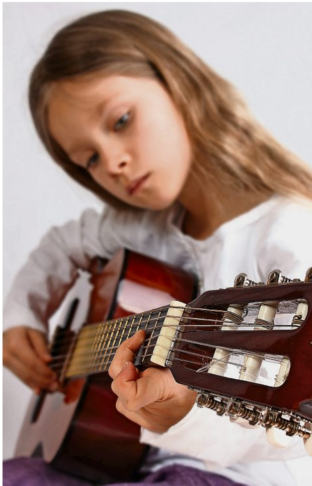
Gitarre ist eins der beliebten Instrumente zum Einstieg.

Ab dem Vorschulalter rücken Instrumente weiter in den Fokus. Viele Kinder sammeln erste Erfahrungen mit Triangel, Xylophon oder Triola. In der Schule tauchen die Jungen und Mädchen dann weiter in die Welt der Musik ein, lernen erste Noten kennen und bekommen vielleicht Lust, ein Instrument zu lernen. Experten empfehlen, diesen Wunsch zu unterstützen, denn Musizieren fördert Fantasie, Kreativität und sogar soziale Kompetenzen. Kinder entwickeln mathematische und rechnerische Fähigkeiten, wenn sie Notenwerte und Rhythmen verstehen und umsetzen. Beliebte Einstiegsinstrumente sind Klavier, Gitarre, Violine, Flöte, Schlagzeug, Keyboard und Blockflöte. Manche Mu-