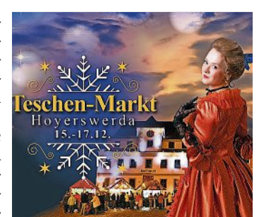
Taschenmarkt, 15.-17.12. Fr 16 bis 22 Uhr, Sa 14 bis 22 Uhr, So 14 bis 20 Uhr, Hoyerswerda, Markt in der Altstadt

Der romantische Adventsmarkt in Hoyerswerda öffnet traditionell am dritten Adventwochenende im Herzen der Altstadt. Glühwein, Bratwurst, Zuckerwatte und gebrannte Mandeln dürfen dabei nicht fehlen. Gönnen Sie sich eine kleine Auszeit, verwöhnen Sie Ihren Gaumen und stimmen Sie sich gemeinsam auf ein besinnliches Fest ein.