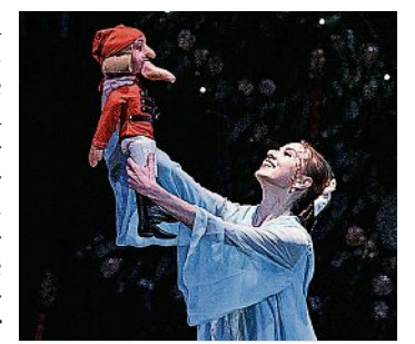
Ballett Der Nussknacker am Sonntag, 10.12., um 17 Uhr in der Lausitzhalle Hoyerswerda, Tickets ab 47,99 Euro

Die Geschichte führt in das Zauberreich, wo das Gute und das Schöne herrschen und wohin man auch als Erwachsener immer wieder zurückkehren möchte. Die Pracht von Bühnenbild und Kostümen, die märchenhafte Handlung, die Musik und der Tanz vervollständigen das Werk voller Romantik und machen den Ballettabend zum Fest.