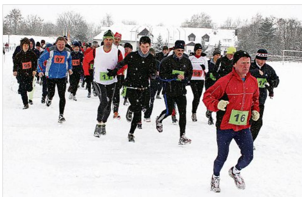
Unter anderem der Neujahrslauf - hier ein Bild aus dem Jahr 2010 - findet im Hoyerswerdaer Sportforum statt.