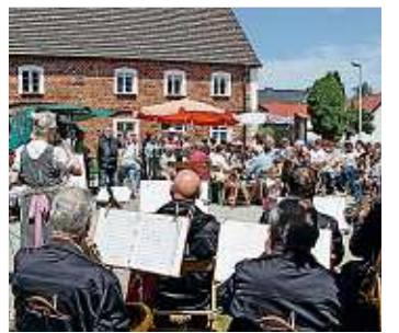
Frühlingsfest am Samstag, den 18. Mai von 11 bis 18 Uhr auf dem Zeißighof im Hoyerswerdaer Ortsteil Zeißig