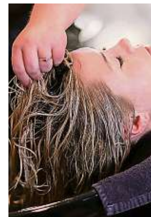
Allergiker sollten bei Naturprodukten vorsichtig sein.

Heuschnupfengeplagte müssen derzeit wieder allabendlich ihre Haare waschen, um tagsüber „eingesammelte“ Pollen möglichst nicht auch mit ins Bett zu nehmen. Denn die am Tag herumfliegenden Gräserpollen würden sonst auch nachts für Probleme sorgen – obwohl Allergiker ja nachts zumindest bis in die frühen Morgenstunden hinein ein wenig Ruhe vor den für Schnupfen, kribbelnde Augen und mitunter auch asthmatische Probleme sorgenden Pollen haben. Die fliegen in diesen Stunden nicht. Es sei denn, sie haben es sich zuvor auf dem Kopfkissen „bequem machen“ können.