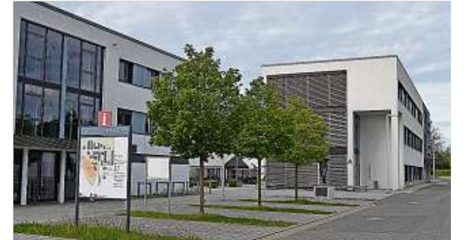
Die Hauptgebäude der Landesfeuerwehr- und Katastrophenschutzschule in Nardt: Sie sind verhältnismäßig neu. Trotz- dem reicht der Platz für die Zukunft nicht aus.

6.157 Personen haben im ver- gangenen Jahr Lehrgänge in der Landesfeuerwehr- und Ka- tastrophenschutzschule des Freistaats Sachsen besucht, der Bedarf ist nach wie vor höher. Von Verantwortlichen heißt es, der immer noch geplante weitere Ausbau hänge vom Doppelhaushalt 2025/26 ab. Das zuständige Innenministe- rium würde gern mit mehr Räumlichkeiten, mehr Ausrüs- tung und mehr Personal dafür sorgen, dass im Jahr um die 8.000 Feuerwehrleute zu Schu- lungen nach Nardt kommen können. Anhaltende Kapazi-