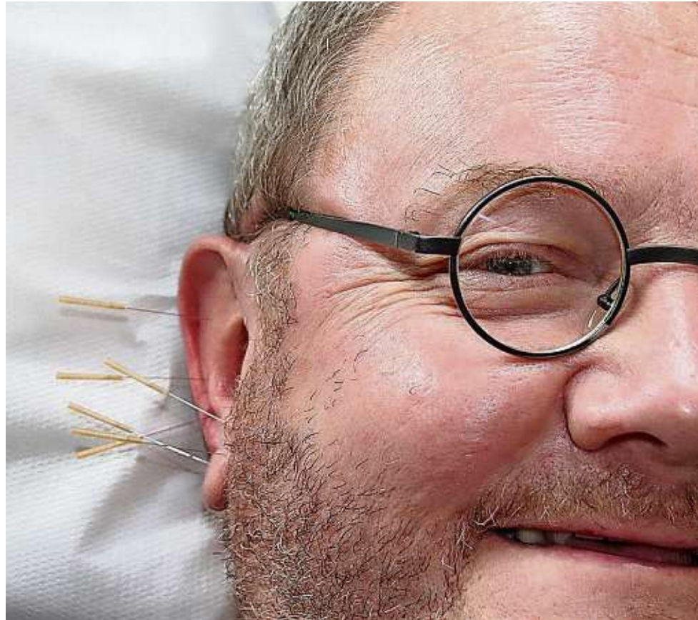
Kleine Nadeln am Ohr können helfen, Heuschnupfensymptome deutlich zu lindern. Das ist längst auch wissenschaftlich belegt.

samt. Etwas, was auch mit Blick auf Allergien wichtig ist, unterstreicht Chunhua Cen. Und verweist noch einmal darauf, „dass wir dabei immer Teil auch der gemeinsamen Behandlung mit dem Hausarzt oder den HNO-Spezialisten sind“. Und dort setzt man dann auch auf weitere erfolgreiche Möglichkeiten im Kampf gegen die nervigen und auch körperlich belastenden Auswirkungen der Pollenallergie. Eine davon ist die Hypo-sensibilisierung; vereinfacht umschrieben eine „Impfung“ mit Allergenen. So soll das Immunsystem über drei bis fünf Jahre lang an das Allergen gewöhnt werden. Schließlich ist das Ganze ja quasi eine Fehl- oder zumindest Überreaktion der Immunabwehr des Körpers. Das Immunsystem sieht die über die Nasen- oder Mundschleimhäute „eindringenden“ eigentlich absolut ungefährlichen Pollen als Gefahr und bekämpft sie.