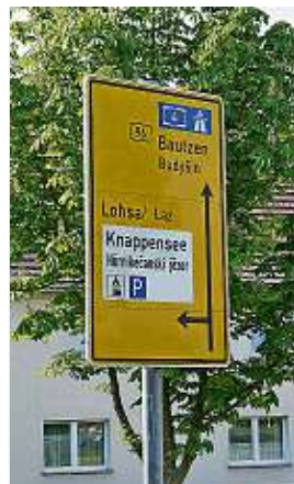
Der Tourismus am Knapensee ist durch die Sanierungsarbeiten seit zehn Jahren ausgebremst.