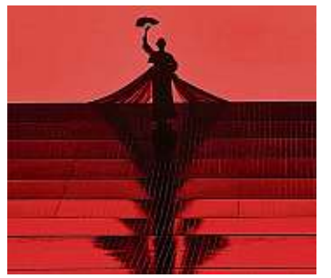
Madame Butterfly am 11. Mai um 19 Uhr als Live-Übertragung im Cinemotion Hoyerswerda

Die Oper des Italieners Giacomo Puccini spielt Anfang des 19. Jahrhunderts in Japan und kommt an diesem Abend live aus der Metropolitan Opera in New York ins Cinemotion nach Hoyerswerda. Die Reihe „Oper im Kino“ macht's möglich. Wer also große Oper und großes Kino sucht und dafür nicht weit fahren will, ist hier richtig.