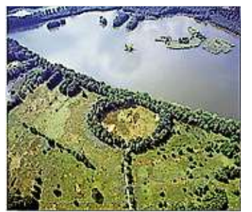
Die Oberlausitz im frühen Mittelalter am 15.5., 18 Uhr im Schloss Hoyerswerda, Anmeldung: info@lausatia-verband.de

Beim neuen Themenabend geht es um die Geschichte der Oberlausitz im frühen Mittelalter. Hier war einst ein riesiges Waldgebiet. Um 200 n.Chr. wanderten Germanen ein, seit dem 8. Jahrhundert rückten von Osten slawische Stämme nach. Der Raum wird durch die Milzener besiedelt, deren Nachfahren wir Obersorben nennen...