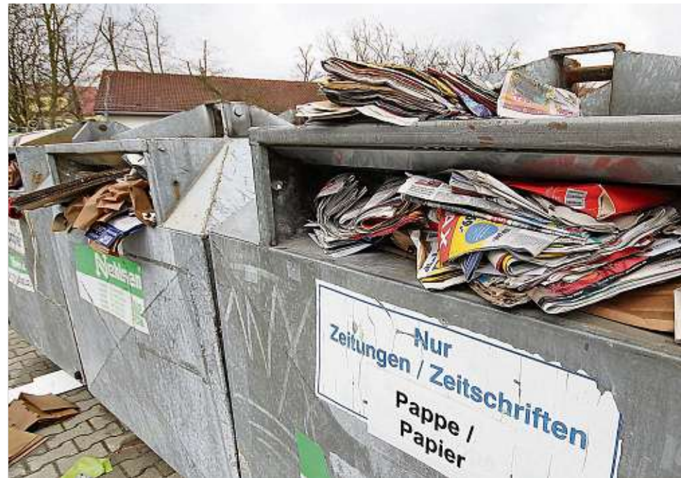
Dieses Foto ist beispielgebend für die Zustände, wie sie an vielen Wertstoffcontainerplätzen herrschen - nicht nur in Hoyerswerda, sondern überall im Landkreis.